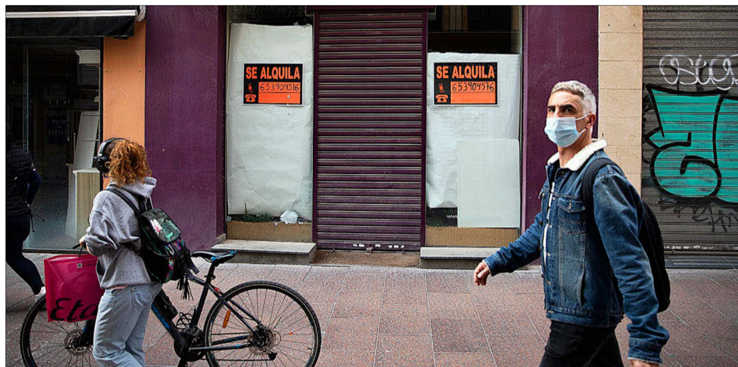
Locales cerrados y puestos en alquiler en una calle del centro de Sevilla.